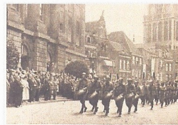
Parade voor het stadhuis in Utrecht van het Regiment Genietroepen in 1938.

In 1748 werd bij het toenmalige Staatse leger het Regiment Genietroepen opgericht. Pas in 1888 kreeg het Regiment een eigen muziekkapel. Deze kapel, in de volksmond de geniemuziek geheten, werd opgericht in Utrecht, de plaats waar het Regiment destijds was gelegerd.