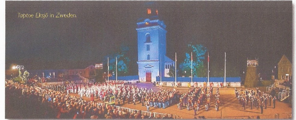
Taptoe Eksjö in Zweden.

van de Heinekenfanfare, 1 militair van de Defensie Verkeers- en Vervoersorganisatie en vier bemanningsleden van de Belgische C-130. Jonge levens gingen verloren. Het Regiment treurde. Maar hoe hard ook, het leven ging door en in 1997 beschikte het Fanfarekorps Koninklijke Landmacht weer over een adequate bezetting van militaire beroepsmusici.