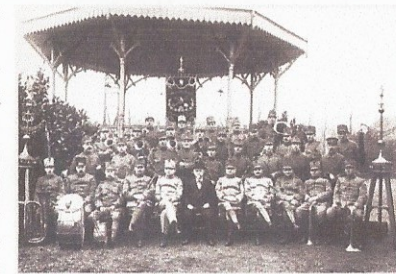
Beginjaren van de Geniemuziek.

De kapel bestond uit genieonderofficieren die in hun vrije tijd een instrument bespeelden. Zij kregen van de regimentscommandant faciliteiten om te repeteren onder de voorwaarde dat ze als tegenprestatie alle feestelijke gelegenheden en ceremonies van het Regiment zouden opluisteren. Een praktische en typische genieoplossing die tot het begin van de Tweede Wereldoorlog prima werkte. De mobilisatie en de vernietiging van alle instrumenten tijdens het bombardement van Rotterdam maakte een einde aan het bestaan van de kapel.